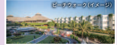
ビーチウォーク(イメージ)

ビーチの目の前にある話題のショッピングスポット。約200ものショップがあり、ファッションやお土産、グルメまでなんでも揃っています。