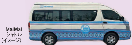
MaiMai シャトル (イメージ)

クタ、スミニャック、ヌサドゥア、ジンバランを走る滞在中何度でも利用できるシャトルバスが乗り放題! ※ニュービ期間、レバラン期間、年末年始は除く。