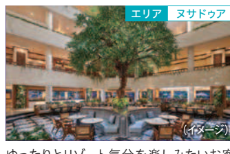
エリア ヌサドゥア