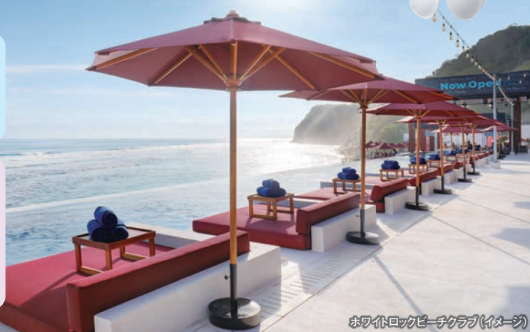
ホワイトロックビーチクラブ(イメージ)