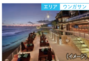
エリア ウンガサン

メラスティビーチにある最大規模のビーチクラブ! エメラルドグリーンの綺麗な海を眺めながら南国の雰囲気を楽しめます。