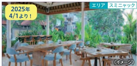
エリア スミニャック