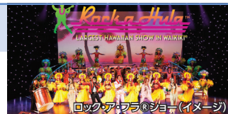
ロック・ア・フラ®ショー (イメージ)