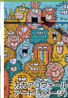
カカアコウアールアート (イメージ)