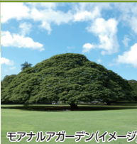
モアナアガーデン (イメージ)

※不催行日: 2025年12/25、2026年1/1、2/14 ※最少催行人員: 2名 ※モアナアガーデンの入園料 (13歳以上: 10ドル、6~12歳: 7ドル) は含まれておりません。現地で別途お支払いください。現地にてお釣りの用意がないことも予想されますため、お釣りのないようお持ちください。※チップは含まれておりません。