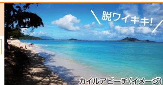
カイルアビーチ (イメージ)

※最少催行人員: 2名 ※不催行日: 2025年12/14、25、31、2026年1/1