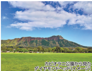
カピオラニ公園から見たダイヤモンドヘッド (イメージ)

※不催行日: 2025年12/14-25、2026年1/1 ※最少催行人員: 1名 ※ツアー参加当日に免責同意書への署名が必要です。※ツアー行程は現地事情により事前通告なく変更になる場合があります。また、当日の天候によってはツアーが中止となる場合があります。