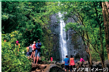
マノア滝 (イメージ)

※毎週土・日曜、2025年12/14、25、31、2026年1/1、19、2、16は不催行となります。 ※最少催行人員: 2名